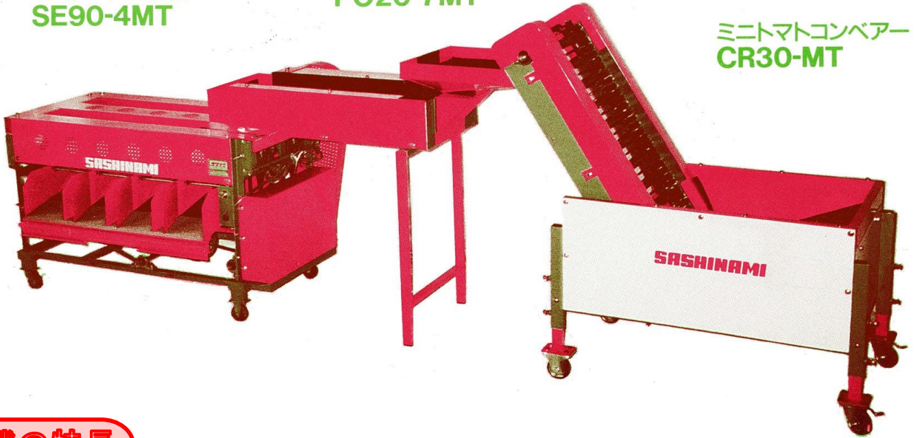
ミニトマトコンベアー CR30-MT