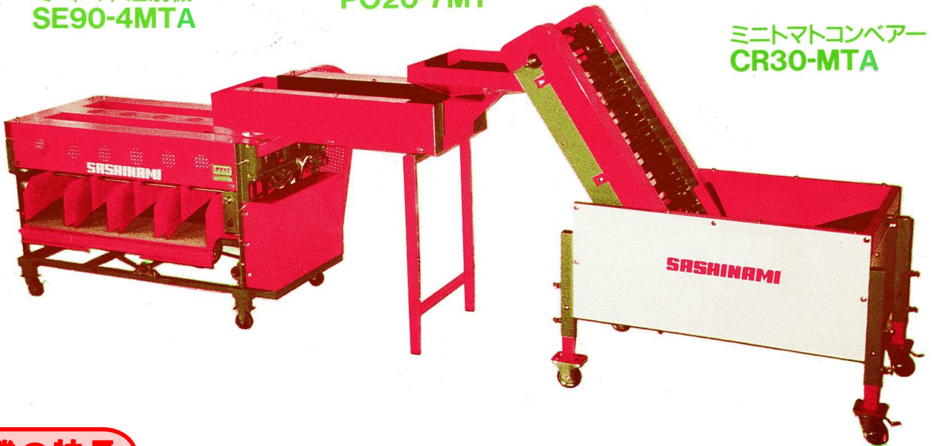
ミニトマトコンベアー CR30-MTA